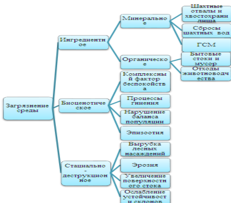
Рисунок 1 – Классификация загрязнений экологических систем в среднем течении реки Уруп

Сопоставляя выявленные в среднем течении реки Уруп антропогенные загрязнения с наиболее общей классификацией загрязнений экологических систем получаем частную классификацию, загрязнений экологических систем в среднем течении реки Уруп (Рис.1).