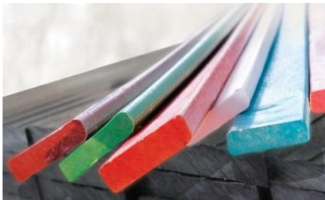
Рисунок 1. Полимерный профиль

Изделия из вторичного сырья находят применение в различных областях жизнедеятельности. Противофильтрационные экраны имеют широкий спектр применения в нефтяной промышленности, сельском хозяйстве, строительстве. Геомембрана - в строительстве, сельском хозяйстве, нефтегазовой промышленности и других производственных сферах. Различного вида пленки – в сельском хозяйстве, пищевой промышленности и в качестве гидроизоляции. Полимерный профиль (рис. 1) используется для облагораживания дачных участков, изготовления заборов, скамеек и прочее. Газонные решетки – для оснащения парковок, устройства пешеходных площадок.