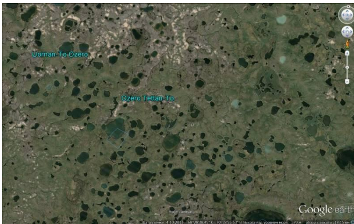
Рисунок 1 – Вся земля тут испещрена дырами, ставшими озерами

По мнению ряда исследователей, полуостров Ямал может скрывать ещё большее количество воронок, пока что не обнаруженных учёными и местными жителями. Если учесть размеры полуострова (700 на 240 километров) и его крайне малую заселённость, в это несложно поверить. К тому же эти аномальные дыры могли превратиться в озера, а их на полуострове великое множество (рисунок 1). Распознать же в водоёме бывший провал без специального исследования крайне затруднительно.