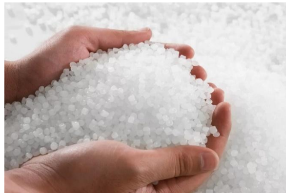
Рисунок 2. Гранулы после вторичной обработки пластмасс

На сегодняшний день в России существуют производства по вторичной обработке пластиковых отходов. Но к сожалению количество их мало. Проблема утилизации пластиковых отходов с каждым годом будет вставать острее, именно поэтому необходимо искать эффективные пути решения и технологии для ее решения.