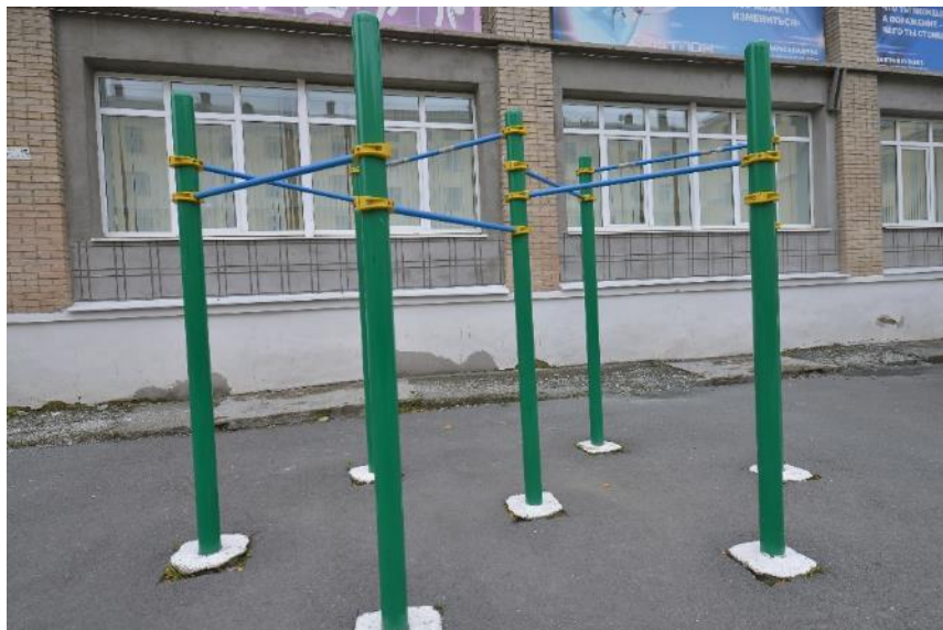
Турник с перекладинами для подтягивания