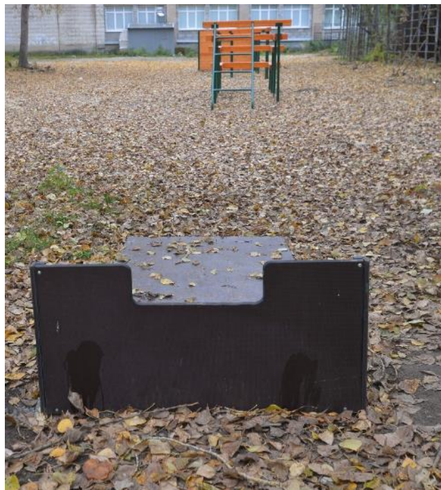
Одиночный окоп для стрельбы и метания гранат