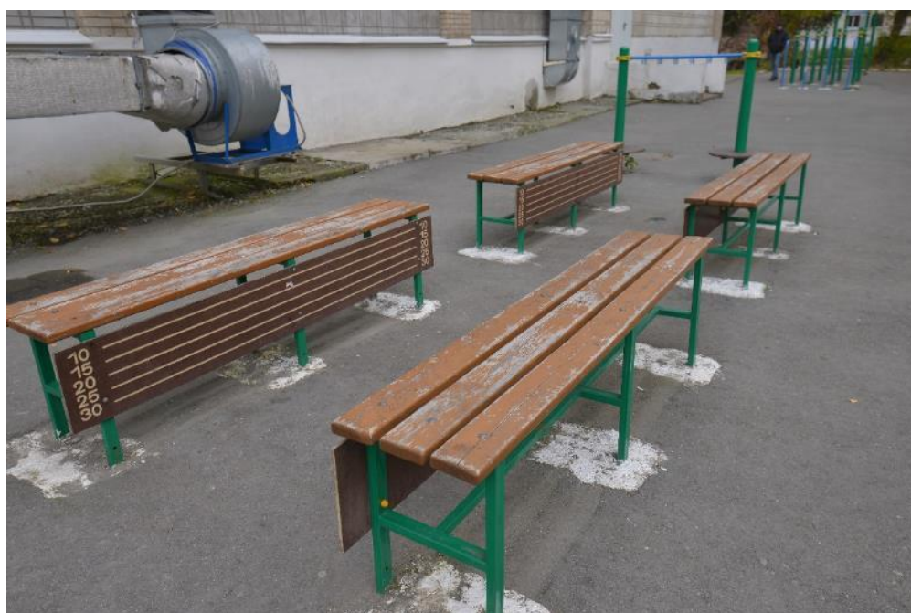
Скамейки для развития гибкости