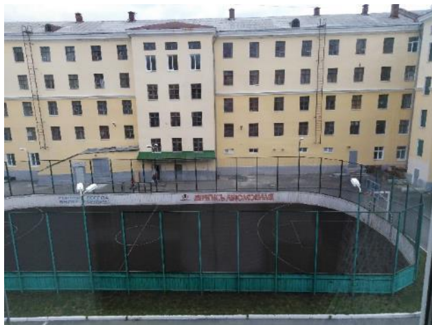
Спортивная площадка для игровых видов спорта