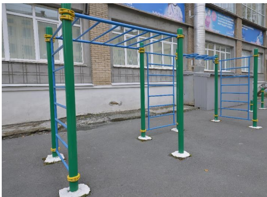
Шведская стенка, рукоход