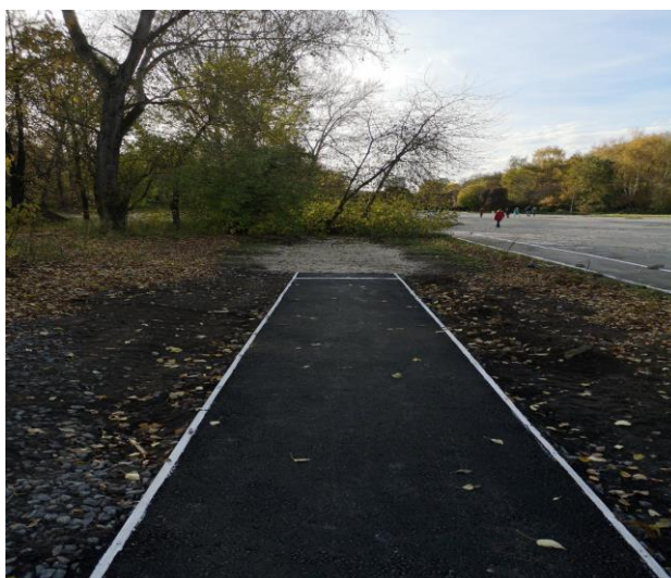
Площадка для прыжков в длину