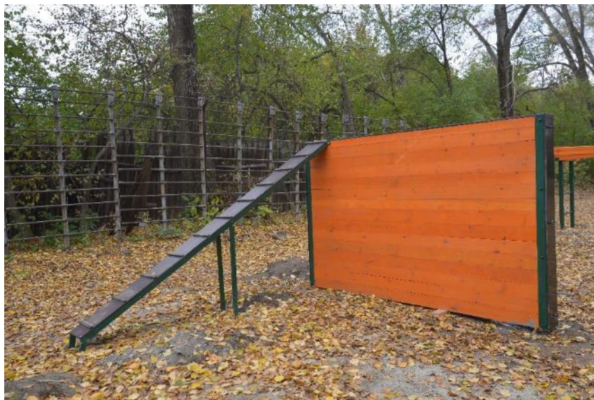
Забор с наклонной доской