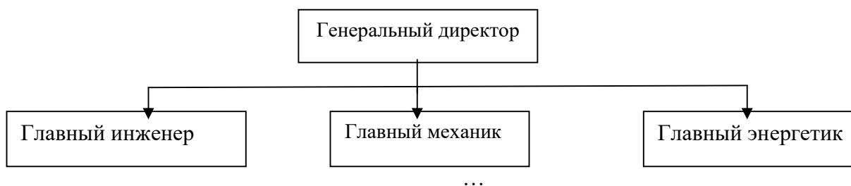
Рисунок 1 – Структура администрации организации

Рисунки, за исключением рисунков в приложениях, следует нумеровать арабскими цифрами сквозной нумерацией по всей работе. Каждый рисунок (схема, график, диаграмма) обозначается словом «Рисунок», должен иметь заголовок и подписываться следующим образом – посередине строки без абзачного отступа, например: