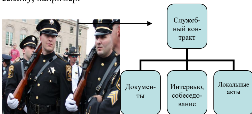
Рисунок 1 - Процесс заключения служебного контракта [8, с. 46]

Если рисунок взят из первичного источника без авторской переработки, следует сделать ссылку, например: