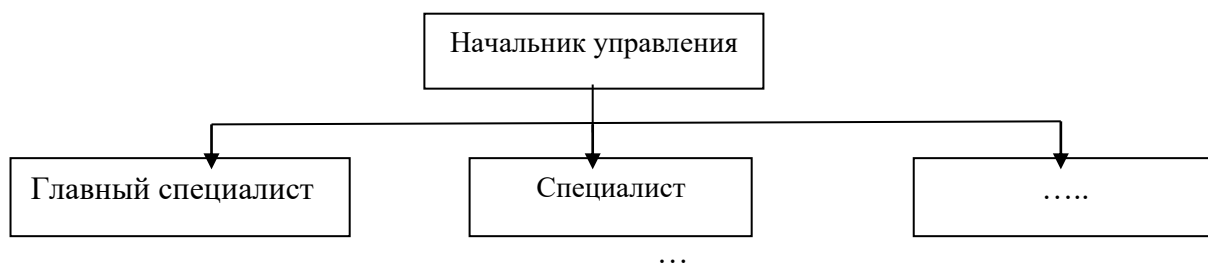
Рисунок 1 – Структура управления

Если на рисунке отражены показатели, то после заголовка рисунка через запятую указывается единица измерения, например: