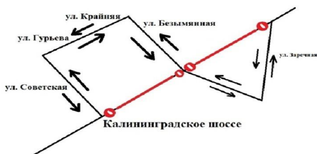
Рисунок 2 – Схема объезда 1

Если рисунок является авторской разработкой, необходимо после заголовка рисунка поставить знак сноски и указать в форме подстрочной сноски внизу страницы, на основании каких источников он составлен, например: