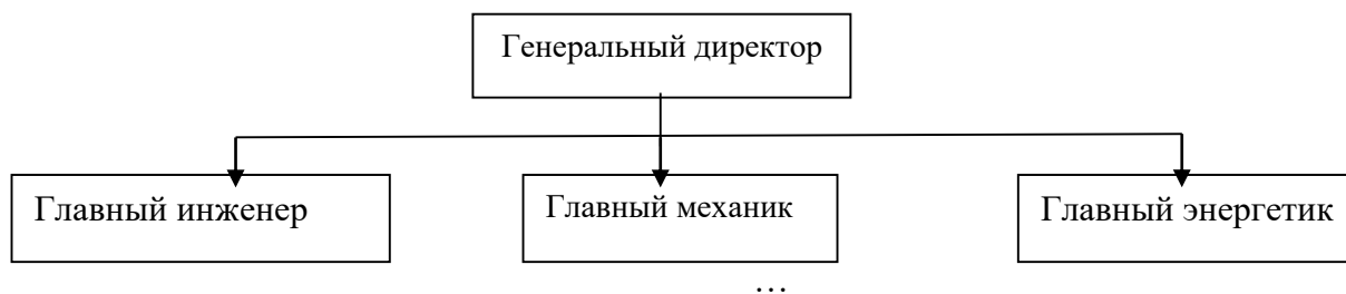
Рисунок 1 – Структура администрации организации

Рисунки, за исключением рисунков в приложениях, следует нумеровать арабскими цифрами сквозной нумерацией по всей работе. Каждый рисунок (схема, график, диаграмма) обозначается словом «Рисунок», должен иметь заголовок и подписываться следующим образом – посередине строки без абзачного отступа, например: