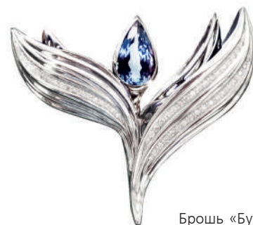
Брошь «Бутон»: золото, бриллианты, танзанит