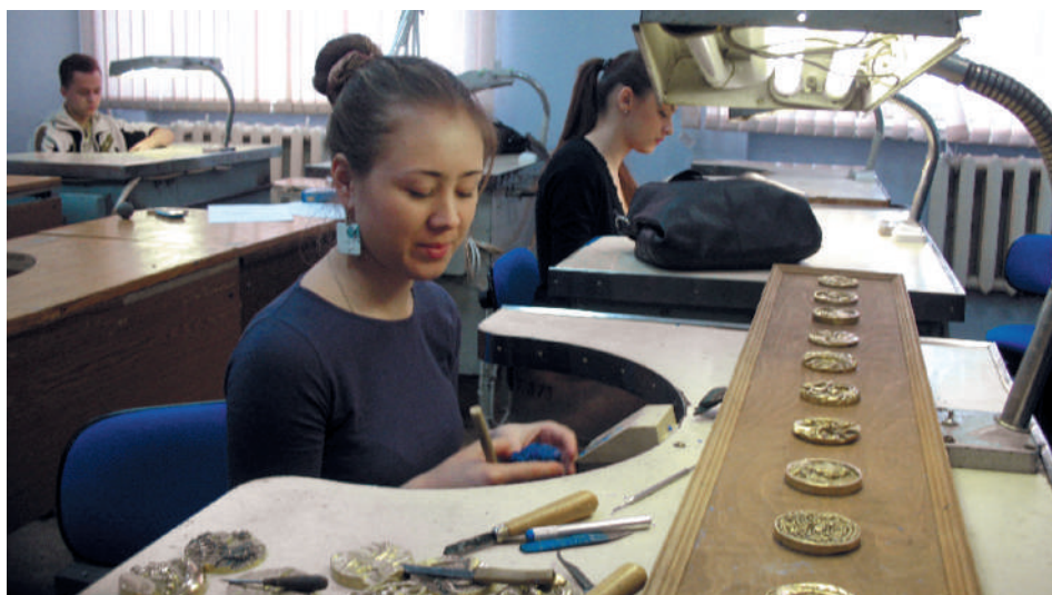
Практическое занятие в учебной лаборатории

На кафедре художественного проектирования и теории творчества (ХПТТ) УГГУ планируется прием на ускоренное обучение по очно-заочной форме по профилю бакалавриата « Художественное проектирование ювелирных изделий ». Это отличная возможность для трудоустроенных выпускников колледжей и техникумов по родственным специальностям получить высшее образование, не покидая рабочих мест. Срок обучения составит 3,6 года. По окончании университета выпускникам будет присваиваться уникальная квалификация художника-стилиста , которая позволит успешно работать: