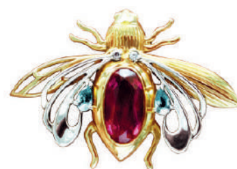
Брошь «Цокотуха»: серебро, позолота, корунд, топазы