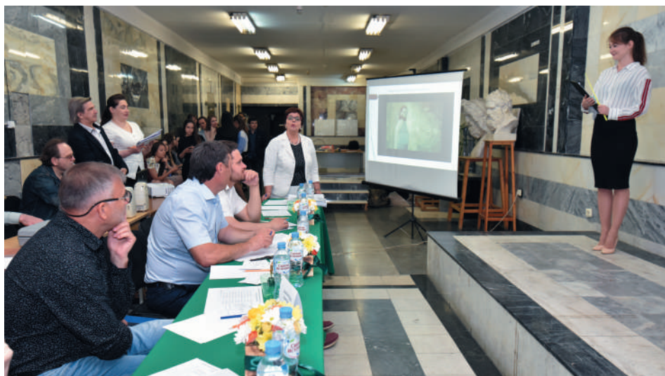
Защита выпускных квалификационных работ на кафедре ХПТТ