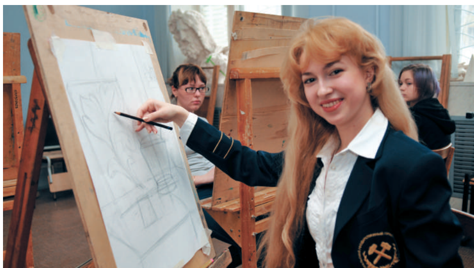
Занятие по рисунку и живописи