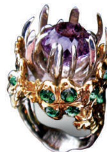
Кольцо «Счастливый клевер»: серебро, позолота, топазы, аметист, аромат луговых цветов