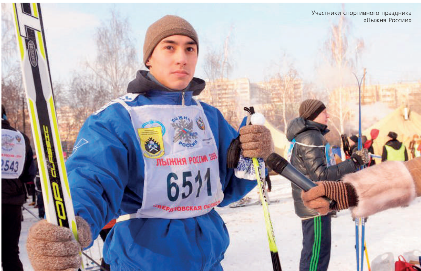
Участники спортивного праздника «Лыжня России»