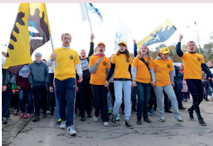
Горняки представляют свой вуз на «Кроссе нации»

В ноябре в вузе проходит также самое веселое студенческое шоу — Открытый фестиваль команд КВН УрФО на Кубок УГГУ «Уральские горы юмора» . Его участники — лучшие команды со всей России, а главный приз — 100 тысяч рублей. Проявил себя в творчестве — прояви и в спорте. На Спортивном фестивале первокурсников студенты разыгрывают между собой награды в различных видах спорта, команды формируются по факультетам.