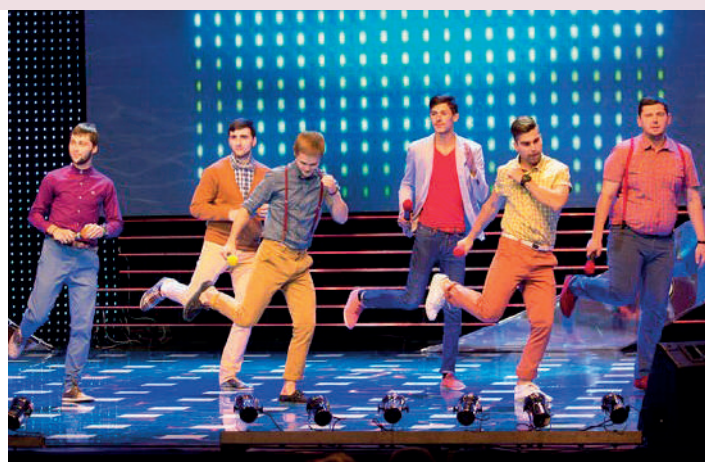
Знаменитая горняцкая команда «Качели» на фестивале «Уральские горы юмора»