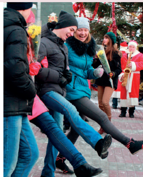
В Татьянин день чествуют Татьян