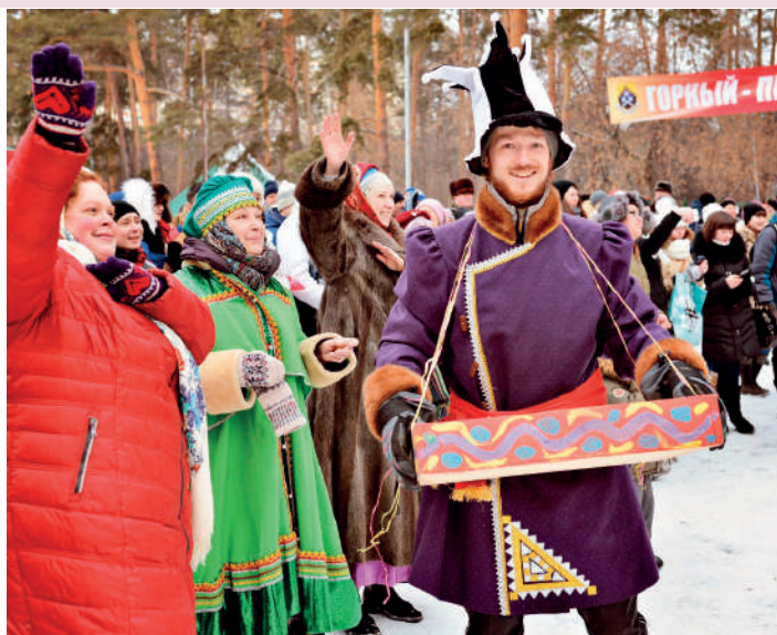
Народ на Масленице угощают настоящие коробейники

Какой горняк не любит русскую Масленицу , знаменующую окончание зимы! Ее любят все, а традиционные блины и забавы стали близки и студентам из Гвинеи, Монголии, Китая и многих других стран. Праздник Горный университет организует в парке «Зеленая Роща», куда приходят повеселиться и угоститься блинами жители Ленинского района.