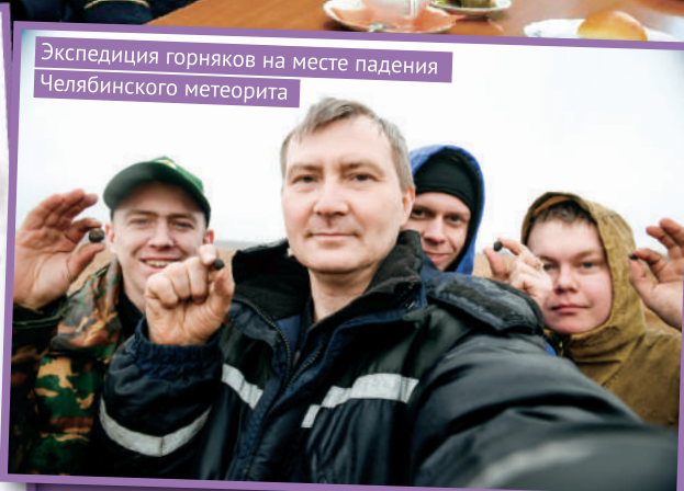
Экспедиция горняков на месте падения Челябинского метеорита