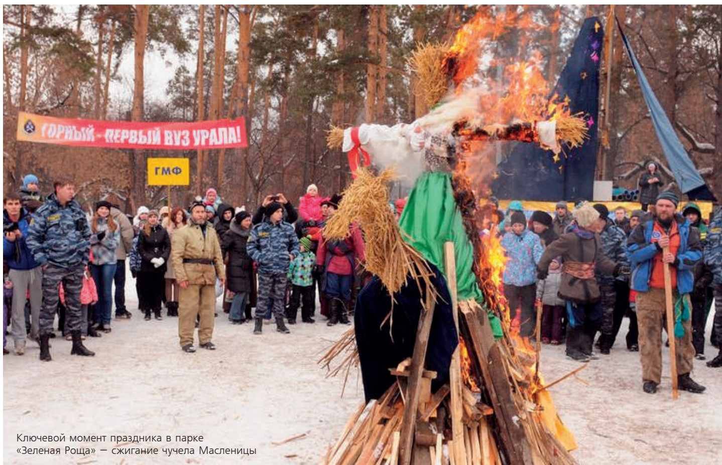
Ключевой момент праздника в парке «Зеленая Роща» – сжигание чучела Масленицы