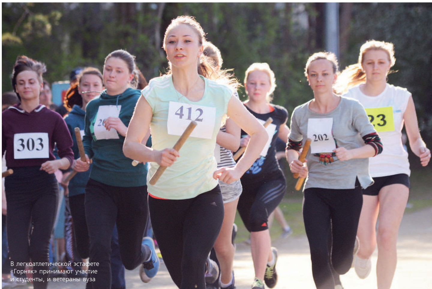
В легкоатлетической эстафете «Горняк» принимают участие студенты, и ветераны вуза