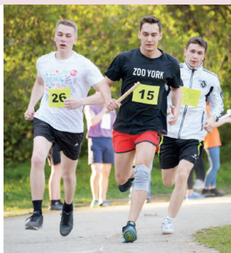
Эстафета «Горняк: красиво бегут!