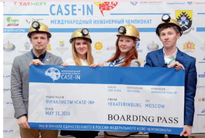
Горняки – финалисты Международного инженерного чемпионата «CASE-IN»