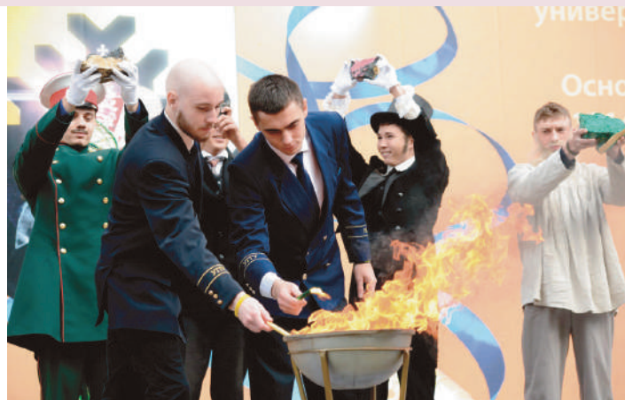
1 Сентября в Горном: зажжение символической чаши знаний

В здоровом теле – здоровый дух, ни один «Кросс нации» не обходится без горящих. Не сотни – тысячи студентов каждый год дружно выходят на старт и бегут единой командой с флагами Горного и прекрасным настроением.