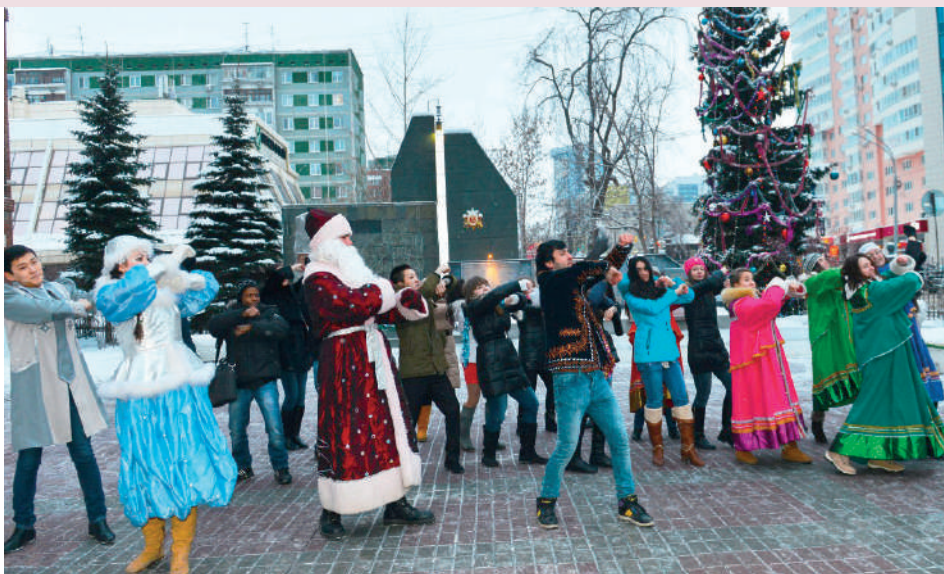
На Международной елке в Горном

В конце декабря в университете зажигает свои огни Международная новогодняя елка . Гости знакомятся с новогодними традициями всего мира, а поздравления в этот день звучат на нескольких иностранных языках. Это единственный пример в Екатеринбурге, когда представители всех народов Урала собираются под Новый год вместе, веселятся, танцуют, поют, водят хороводы и желают друг другу мира и счастья. В Горном университете считают, что уважение к иным традициям, культурам, обычаям надо воспитывать смолоду, поэтому в вузе проводится много мероприятий, раскрывающих национальные особенности народов, живущих на территории нашего округа.