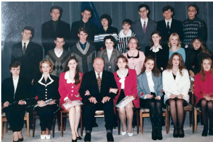
Особенно трогательно вспоминать время учебы, когда меня награждали (1996, 1998 гг.) премией Губернатора Свердловской области (на фото в 1-м ряду слева вторая – я)