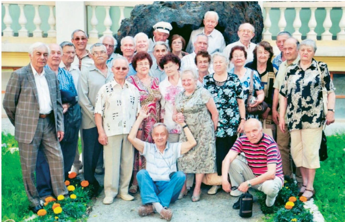
Наша группа на встрече выпускников (у знаменитой жёды, 2013 год)

Трудно укладывается в мыслях, что нет больше СГИ — есть УГГУ (Уральский государственный горный университет). Нет больше Свердловска — есть Екатеринбург (Ебург — как называют его свердловчане). Радует, что ещё есть Мы, выпускники СГИ.