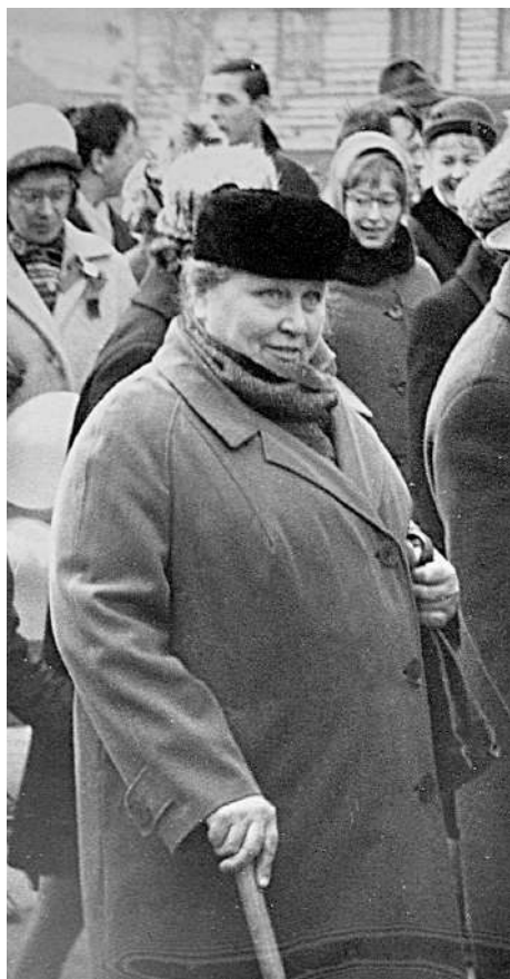
В пожилом возрасте. На праздничной демонстрации