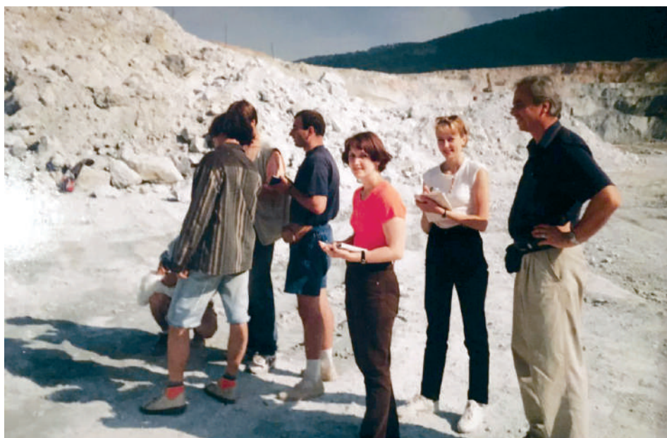
Это фото с практики (справа вторая — я): в Болгарии изучали технологию кучного выщелачивания

Училась я всегда легко и с огромным интересом, вкладывая всю душу в курсовые проекты и конечно же в дипломную работу. Особенно трогательно вспоминать время учебы, когда меня награждали (1996, 1998 гг.) премией Губернатора Свердловской области. Я считаю, что поддержка студентов — это замечательная практика, ведь молодежь, которая только начинает свою самостоятельную жизнь, особенно в этом нуждается. Через 10 лет после окончания академии нас приглашали в резиденцию губернатора, где мы рассказывали Э.Э. Росселю о своих достижениях в жизни и успехах в карьере.