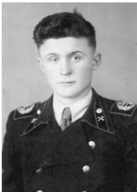
Так выглядел студент СГИ

Почти все мы были иногородними (свердловчан – один-два на группу), все без исключения жили на «стипешку» и не имели какого-либо приработка – на Урале тогда шли закрытия мелких заводиков, а это сокращения и безработица. Одежда парней – лыжный костюм, зимой – телогрейка. Первый костюм и «москвичку» (полупальто) я купил после первой производственной практики, перейдя на четвёртый курс. Но мы были очень активны, серьёзно занимались спортом, художественной самодеятельностью, шахматами. Помню, наш мужской хор занял первое место на первом Фестивале молодёжи и студентов; сборная по боксу стала чемпионом на первом (и последнем, насколько я знаю) чемпионате России (в Сталинграде) и Союза (в Киеве) среди студентов.